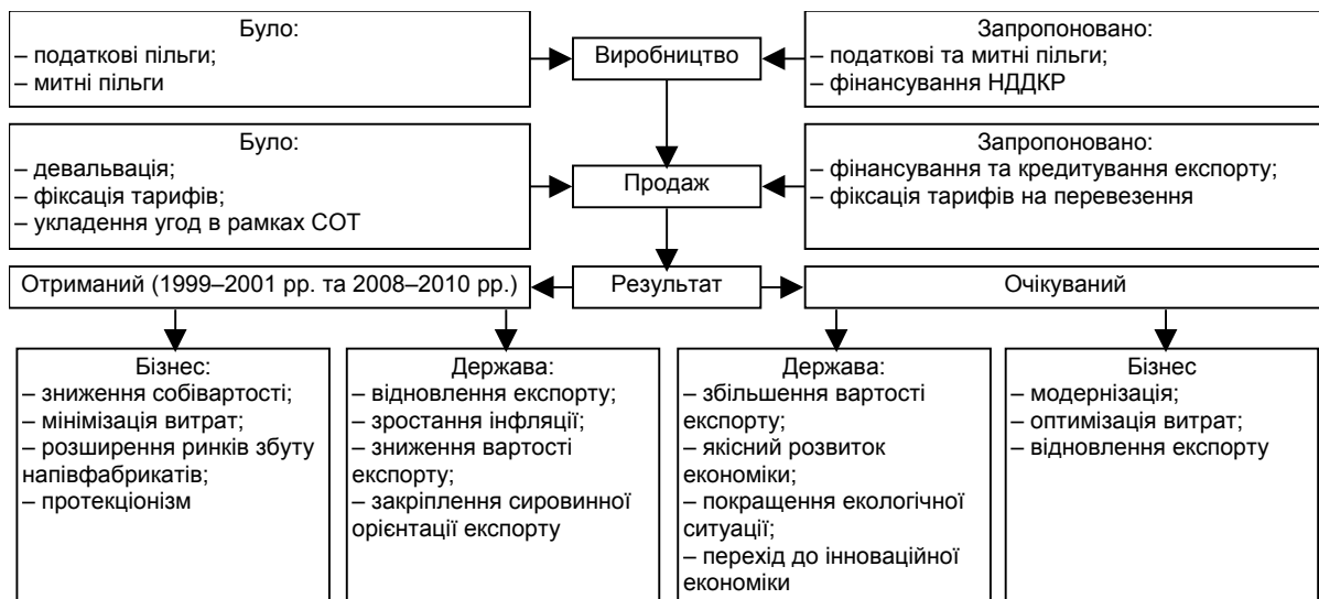
Рис. 1. Інструменти державного регулювання діяльності металургійних підприємств в Україні