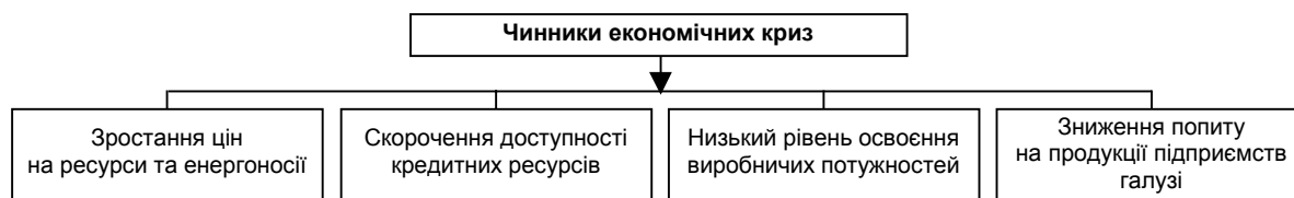
Рис. 2. Чинники, що сприяють виникненню економічних криз у галузі

Можна побудувати ланцюг взаємодії криз, чи ланцюгових кризових реакцій. Виникнення політичної кризи, постійні виборчі кампанії, зміни Кабінету Міністрів призводять до нерозробленості законодавчих та нормативних актів. Політична нестабільність і слабка законодавча база спричиняють недовіру міжнародних інвесторів, зростання рівня інфляції. Інфляція, у свою чергу, призводить до виникнення економічних криз під впливом таких чинників, як скорочення доступності кредитних ресурсів, зростання безробіття, скорочення споживання, зростання ціни на ресурси та енергоносії, скорочення інвестиційної активності підприємств, зростання вартості використання досягнень науки та техніки, зниження попиту на продукцію, низький рівень освоєння виробничих потужностей тощо (рис. 2).