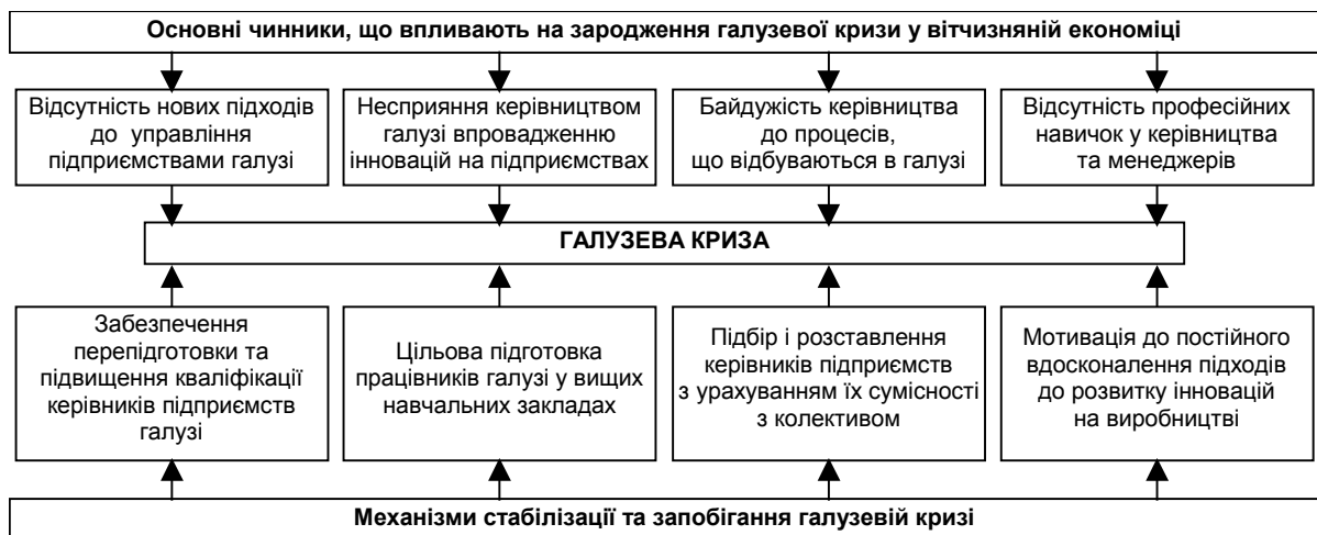
Рис. 1. Процес стабілізації та запобігання галузевій кризі

У результаті виникає нестабільність на підприємствах галузей, як наслідок, – зростає плінність кадрів. Основними механізмами стабілізації в такому разі є оновлення основних засобів за рахунок залучення кредитних коштів та лізингових відносин чи застосування власних інноваційних розробок (рис. 1).