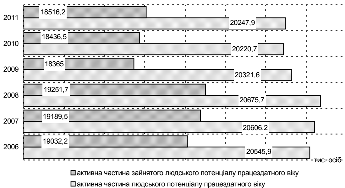
Рис. 2. Графічне оцінювання динаміки A_{ч.п.} працездатного віку за 2006–2011 рр. (авторська обробка даних на основі джерела [3])

З огляду на обмеженість наукової розробки простежимо зміни, які відбулися з активною частиною людського потенціалу працездатного віку за 2006–2011 рр. Інформацію обробили за допомогою комп'ютерної програми Microsoft Excel (рис. 2).