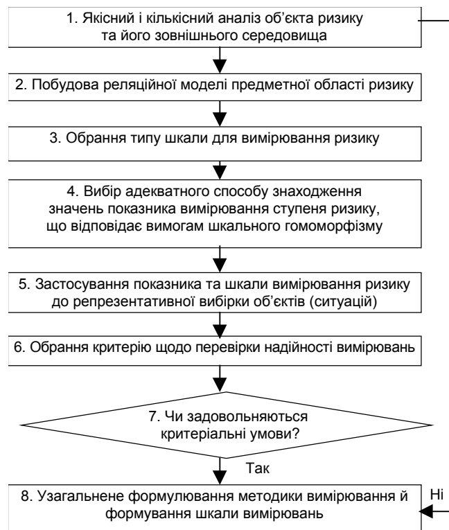
Рис. 1. Узагальнений алгоритм розробки методики вимірювання певного виду економічного ризику

Як приклад застосування теорії вимірювань до вирішення питань ризикології з урахуванням специфіки цієї науки запропоновано узагальнений алгоритм розробки методики вимірювання певних видів і показників економічного ризику (рис. 1) [4, с. 155].