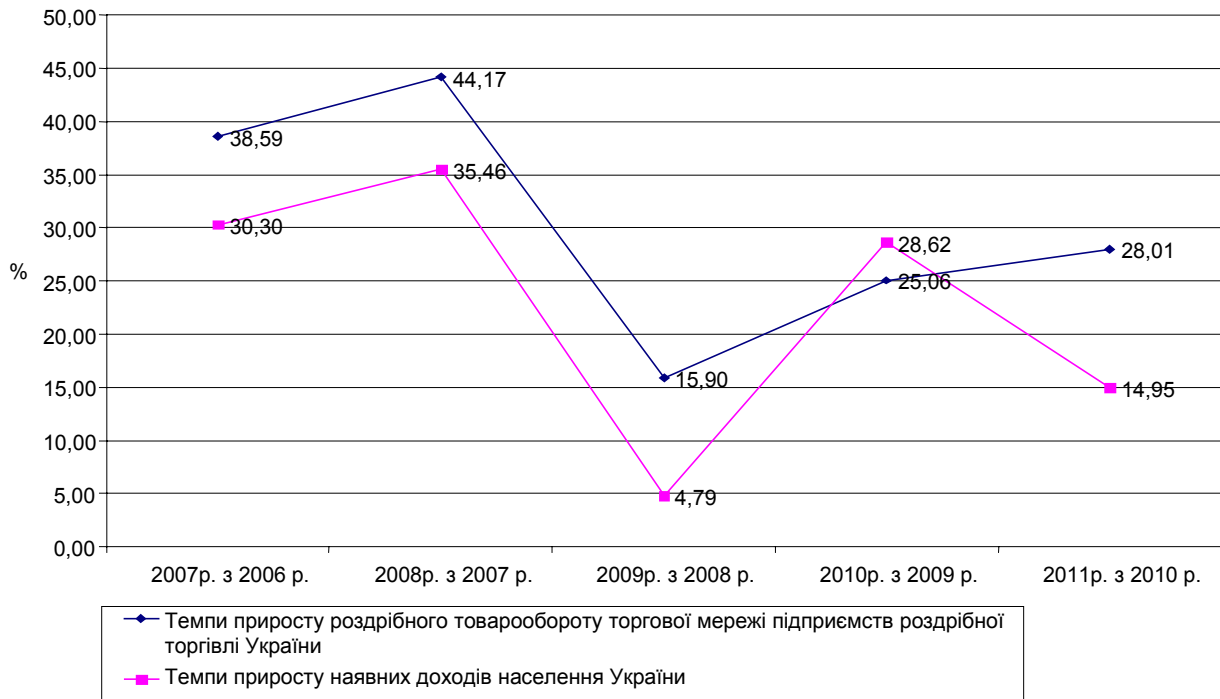
Рис. 1. Порівняльна динаміка темпів приросту роздрібногo товарообороту торгової мережі підприємств роздрібної торгівлі України та наявних доходів населення за 2006–2011 рр. (Розраховано автором на основі даних державного підприємства "Інформаційно-аналітичне агентство" Державної служби статистики України, [9])

наявних доходів населення (рис. 1) свідчить, що за досліджуваний проміжок часу лише у 2010 р. порівняно з 2009 р. темпи приросту наявних доходів населення перевищували темпи приросту роздрібногo товарообороту торгової мережі підприємств роздрібної торгівлі України у 1,14 раза.