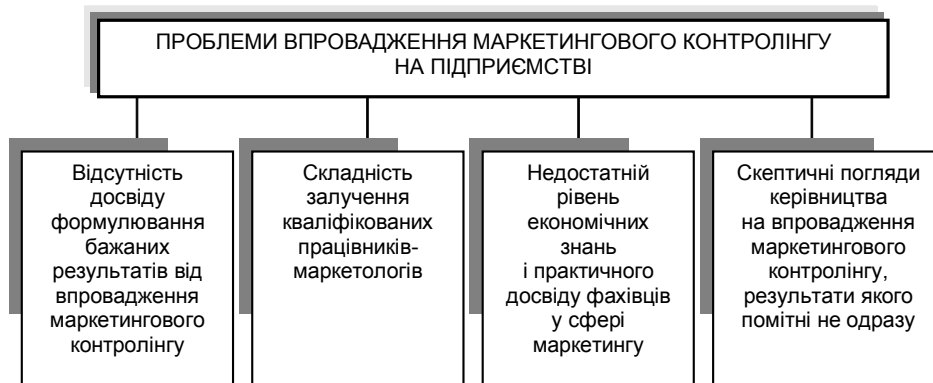
Рис. 2. Проблеми впровадження маркетингового контролінгу на вітчизняному підприємстві

Для ефективної роботи й чіткого визначення відповідальності контролерів на підприємстві має створюватися спеціальний структурний підрозділ – служба контролінгу. Оскільки основна функція контролінгу на підприємстві – аналіз та управління витратами і прибутком, служба контролінгу повинна мати можливість отримувати всю необхідну інформацію й створювати на її основі рекомендації для прийняття маркетингових рішень. Однак на сьогодні існують проблеми впровадження системи маркетингового контролінгу на вітчизняних підприємствах (рис. 2).