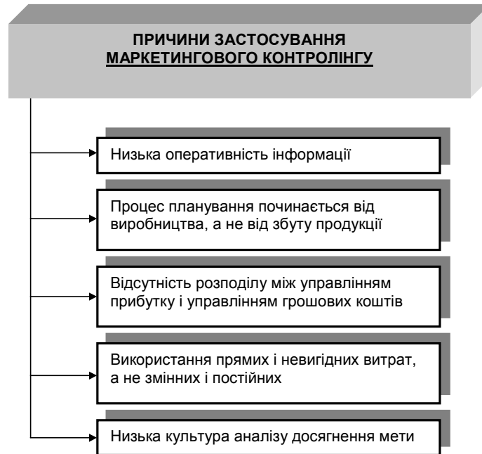
Рис.3. Причини застосування системи маркетингового контролінгу на підприємстві

зації маркетингової служби у підприємства є причини для застосування системи маркетингового контролінгу (рис. 3).