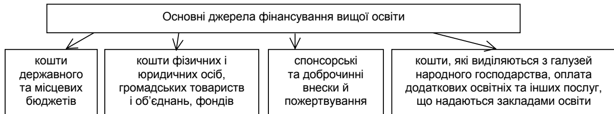
Рис. 1. Структурно-логічна схема основних джерел фінансування вищої освіти [6]

З державного бюджету виділяються кошти лише на фінансування наукових досліджень фундаментального й пошукового характеру або на виконання наукових програм, які мають загальнодержавне значення. Відповідно до чинних норм законодавства, а саме Закону України "Про освіту", виконання цих досліджень і програм здійснюється на конкурсній основі під час вибору найбільш наукомістких та високоефективних у галузі техніки й передової технології, у пріоритетній галузі народного господарства.