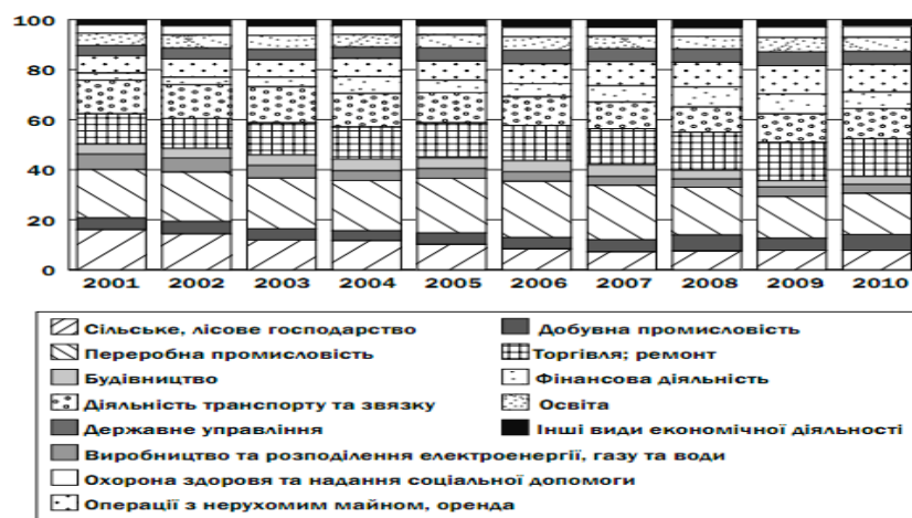
Рис. 1. Динаміка ВДВ України у 2001-2010 рр. за видами економічної діяльності [6, с. 12]

ролі переробної промисловості. Такі тенденції характеризують структуру економіки домінуванням енергоємних, матеріаломістких виробництв, що повною мірою залежать від імпорту паливно-енергетичних ресурсів.