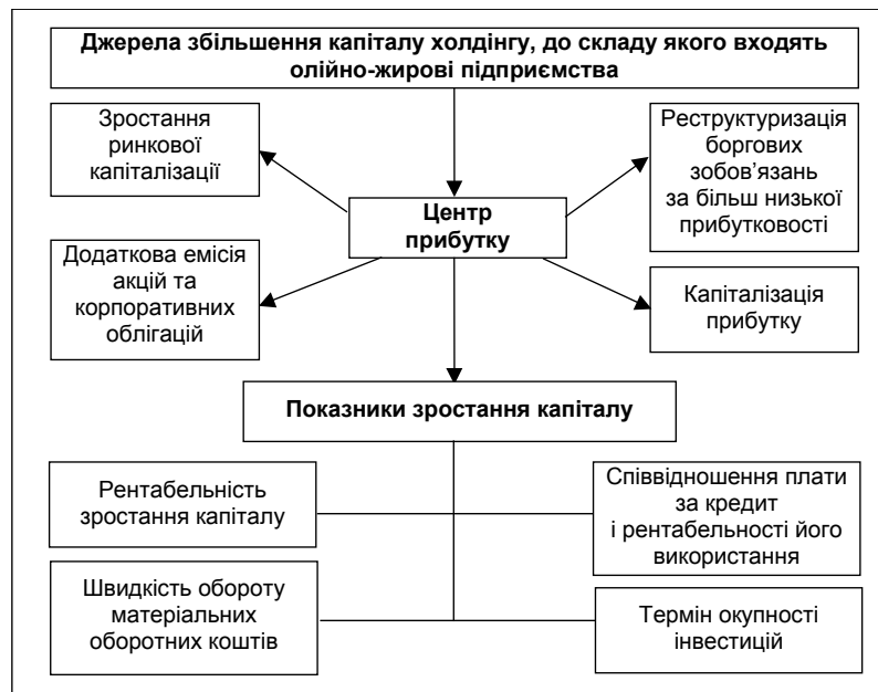
Рис. 2. Джерела збільшення капіталу холдингу, до складу якого входять олійно-жирові підприємства

Успішне інтегрування олійно-жирових підприємств вимагає консолідації фінансів, що передбачає складання балансу, звіту про фінансові результати та грошові кошти. Консолідація звітності, зокрема балансу, приведе до високого рівня об'єднання активів, сприятиме зниженню неплатежів. Це зумовлено тим, що холдингова компанія представлятиме собою групу юридично самостійних, але економічно та фінансово взаємопов'язаних компаній. Також при інтегруванні олійно-жирових підприємств слід урахувувати узгодження інтересів акціонерів, менеджерів і працівників холдингу, захист від ворожих структур. Останнє вбачаємо у консолідації пакетів акцій холдингу, переході на єдину акцію, уточненні процедури прийняття рішень у статутах підприємства.