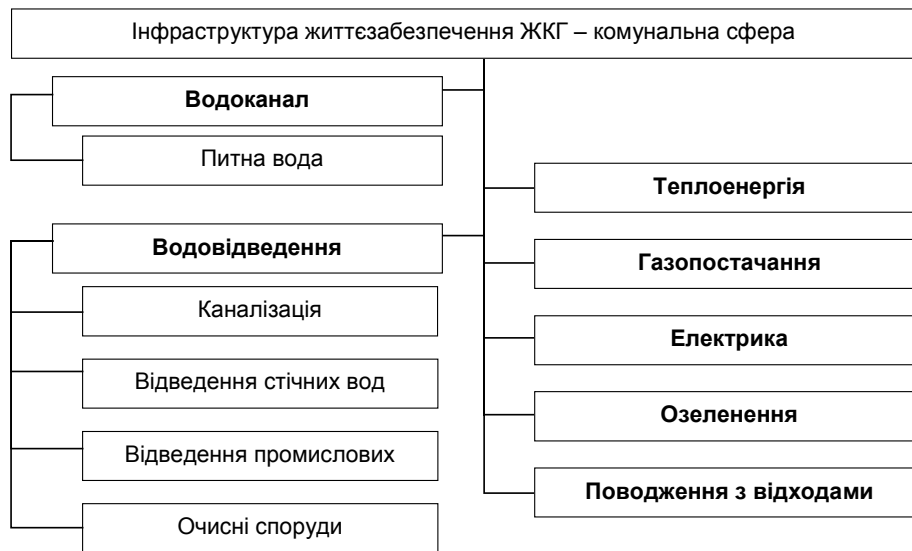
Рис. 2. Складові інфраструктури життєзабезпечення ЖКГ

Інфраструктура життєзабезпечення ЖКГ є базовою для галузі, від її стану та ефективності функціонування залежить стійкість діяльності всього комплексу ЖКГ. На сьогоднішній інфраструктурі властиві високий рівень зношеності основних фондів, суперечливість функцій, високий рівень різних загроз, які виникли завдяки недосконалості законодавчо-нормативної бази. У цьому типі інфраструктури МЖКГ позбавлене функціонально вагомих повноважень і структурно витіснено з цієї сфери державного управління. Самі ж підприємства, які належать до інфраструктури життєзабезпечення, виведені з-під дієвого контролю держави й уже не є елементами процесу державного управління – відсутні планування, комплексний моніторинг і контроль за результатами управлінських рішень. Однак більше занепокоєння викликає те, що