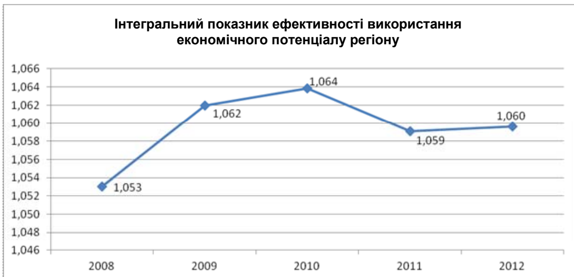
Рис. 2. Інтегральний показник ефективності використання економічного потенціалу регіону

Для характеристики загальної ефективності використання економічного потенціалу Запорізького регіону за 2008–2012 рр. було використано методику обчислення інтегрального показника К.В. Давискіби, в результаті чого встановлено, що економічний потенціал Запорізької області протягом 2008–2010 рр. зростав з 1,053 пункту до 1,064 пункту, проте у 2011–2012 рр. відбулося зменшення ефективності використання економічного потенціалу регіону, що призвело до скорочення інтегрального показника до 1,060 пункту у 2012 р. (рис. 2).