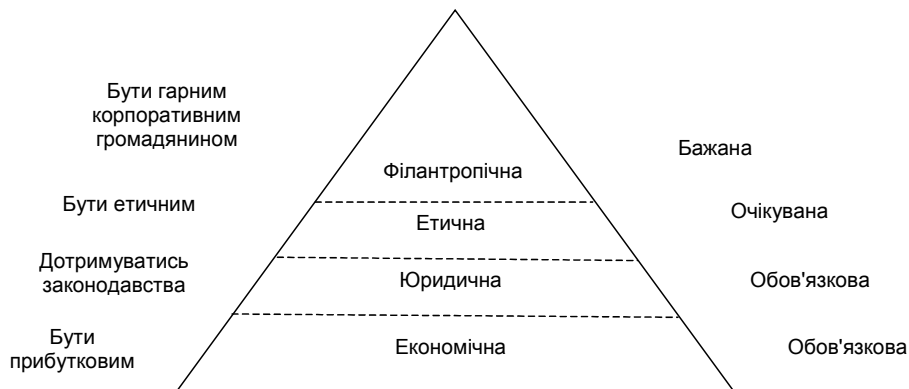
Рис. 1. Піраміда корпоративної соціальної відповідальності А. Керролла [7]

влених осіб. Філантропічна відповідальність полягає в добровільній участі підприємства в благодійних проектах, спрямованих на покращення добробуту суспільства. Зазначений вид відповідальності є бажаним для підприємства.