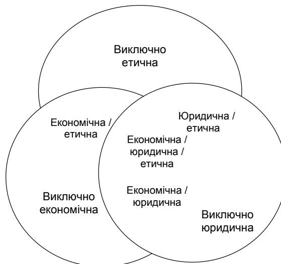
Рис. 2. Удосконалена модель корпоративної соціальної відповідальності А. Керролла та М. Шварца [8]

окремої категорії та врахування останньої в межах етичної та/або економічної відповідальності (рис. 2) [8].