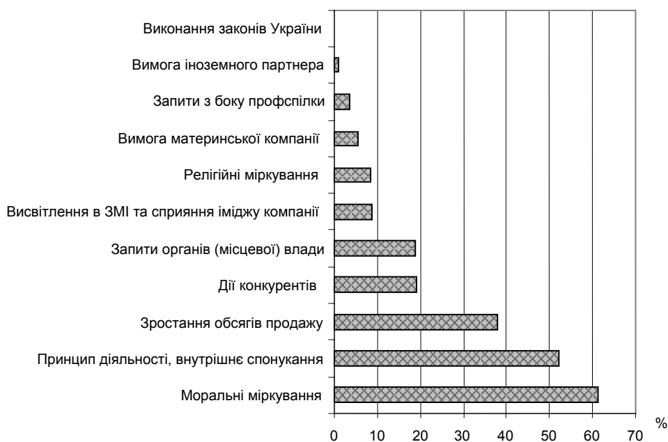
Рис. 3. Чинники, які впливають на здійснення підприємствами соціально відповідальних заходів [3]

За результатами дослідження “Корпоративна соціальна відповідальність в Україні 2005–2010: стан та перспективи”, до найбільш вагомих чинників, які спонукають підприємства впроваджувати соціально відповідальні заходи, належать внутрішні переконання (моральні міркування та внутрішнє спонукання), зростання обсягу продажів, копіювання дій конкурентів і запит з боку органів місцевої влади (рис. 3) [3].