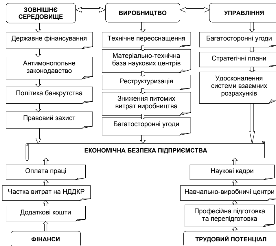
Рис. 2. Схема взаємодії елементів економічної безпеки підприємства

Широкий спектр проблем, з якими пов'язана економічна безпека підприємства, вимагає системного їх розподілу в таких напрямках: технологічна, ресурсна, фінансова й соціальна безпека. Ці підсистеми являють собою комплекс завдань і показників (рис. 2), підвищити її можна, тільки успішно працюючи в усіх напрямках одночасно.