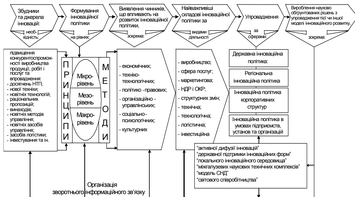
Рис. 2. Основні складові та напрями розвитку організаційного механізму інноваційної політики

Державна інноваційна політика спрямована на безпосереднє господарське використання науково-технічного потенціалу, зміцнення внутрішніх зв'язків підприємств у науково-технічному комплексі. Формування інноваційної політики загалом пов'язане, насамперед, з переорієнтацією системи державного регулювання як на всебічне зацікавлення підприємництва приватної ініціативи, так і на оновлення виробництва на наукових засадах. Організаційний механізм адаптації вітчизняних підприємств до європейських вимог, організаційні складові процесу формування інноваційної стратегії (трансформаційні аспекти) подано на рис. 2, розробленому кафедрою менеджменту інноваційної діяльності та підприємництва Тернопільського національного технічного університету імені Івана Пулюя.