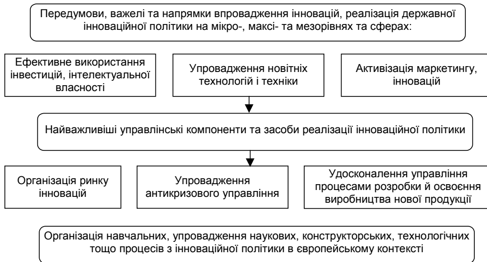
Рис. 4. Організаційний механізм адаптації вітчизняних підприємств до європейських вимог та місце в них інновацій (трансформаційні аспекти)