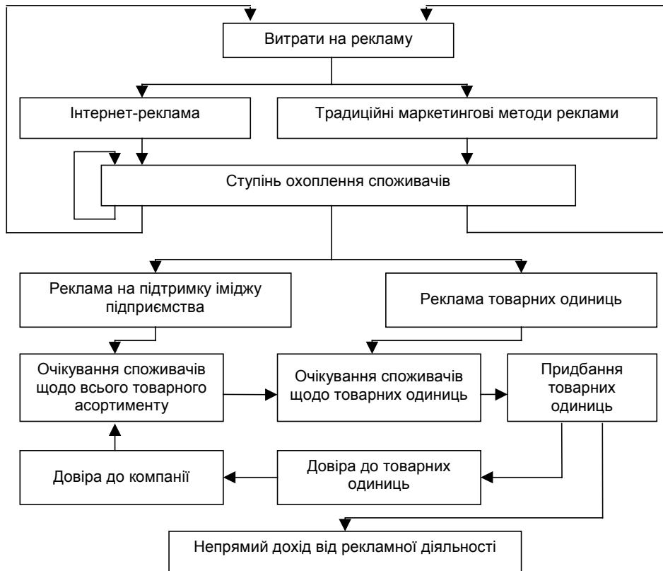
Рис. 1. Формування довіри споживачів до товарів пасивного попиту підприємств харчової промисловості за допомогою рекламної діяльності

При побудові моделі будемо вважати, що вказані показники є постійними і не змінюють своїх значень протягом досліджуваних періодів.