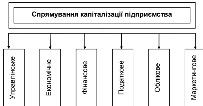
Рис. 1. Аспекти спрямування капіталізації підприємства

Ці складові формують капіталізацію при зміні власника (закупівлі, продажу, злитті, поглинаннях тощо). Стосовно маркетингової капіталізації цей процес слід розглядати з урахуванням особливостей реалізації продукції підприємства на ринку [3]. Усе різноманіття методичних підходів до маркетингової капіталізації підприємства може бути зведено до розуміння її відповідно до конкретних складових цього процесу (рис. 2).