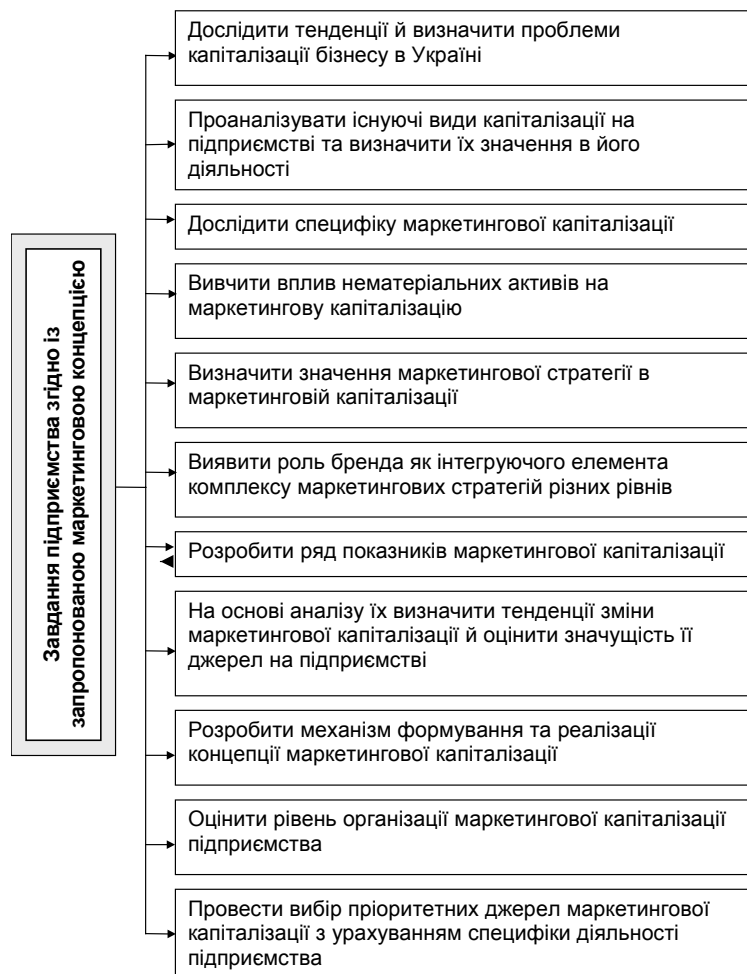
Рис. 3. Базові завдання вітчизняних підприємств згідно із запропонованою маркетинговою концепцією капіталізації

Формування концепції маркетингової капіталізації підприємств вимагає використання накопиченого наукового та практичного досвіду не тільки в галузі маркетингу, а й в економіці, управлінні та фінансах з урахуванням специфіки їх прояву щодо реалізаційної діяльності підприємства. При цьому маркетингову капіталізацію слід розглядати як найважливішу характеристику конкурентоспроможності підприємства і широко використовувати в маркетингових цілях. У цьому полягає сутність запропонованої маркетингової концепції капіталізації вітчизняних підприємств. Відповідно завдання кожного підприємства мають бути розроблені з орієнтацією на підвищенням його капіталізації (рис. 3).