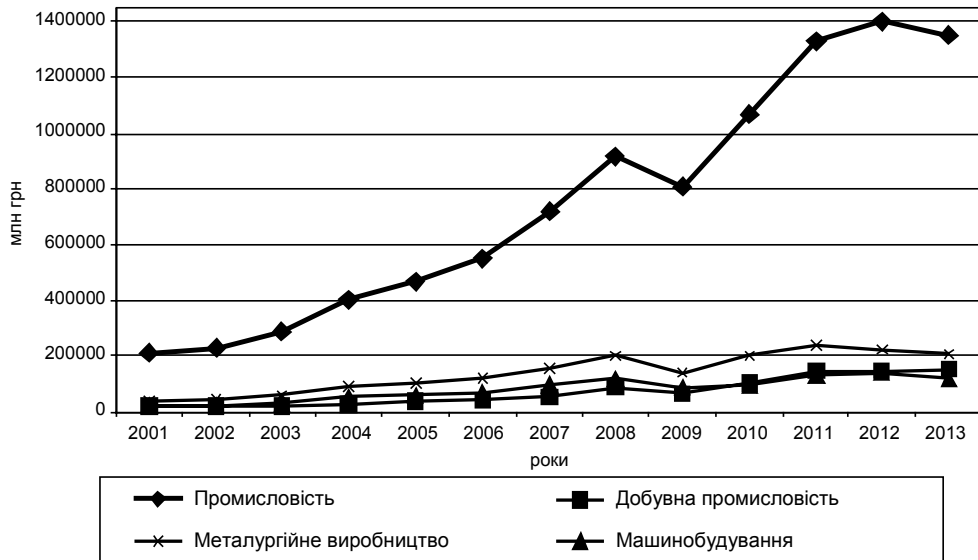
Рис. 1. Динаміка обсягу реалізованої продукції промисловості у 2001–2013 рр.

Водночас питома вага продукції машинобудівної галузі (табл. 1) у структурі продукції важкої промисловості становила у 2013 р. лише 24,4%, у 2012 р. – 27,9%, у 2011 р. – 25,6%, а у 2010 р. – 24,5%. Загалом протягом 2010–2013 рр. питома вага машинобудування у складі важкої промисловості не перевищує 28%. На кілька пунктів цей показник був вищий протягом окремих періодів у 2001–2009 рр. і становив від 26,9% до 31,5%, але його рівень є надто низьким, особливо порівняно з аналогічними показ-