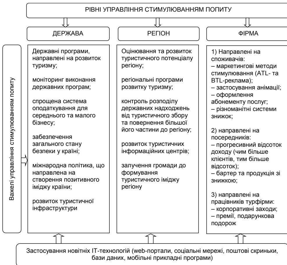
Рис. 2. Трирівнева модель управління стимулюванням попиту на туристичні послуги

Наведемо основні важелі управління стимулюванням попиту на туристичні послуги у вигляді трирівневої моделі управління (рис. 2).