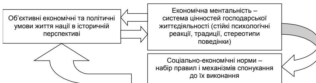
Рис. 1. Вплив ментальності на становлення економічних інститутів*