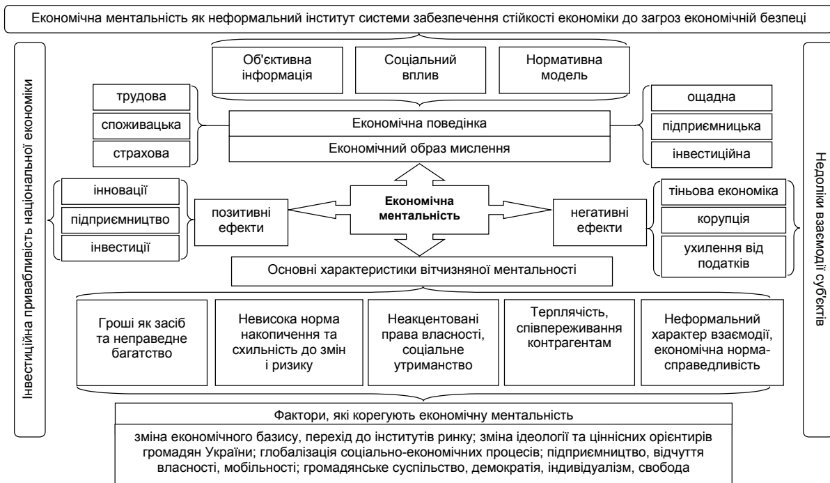
Рис. 3. Характеристика економічної ментальності як неформального інституту системи забезпечення стійкості економіки до загроз економічній безпеці *

г) визначення економічного системного комплексу як структури різних підсистем різної природи, елементів з різними багатовимірними параметрами – останнє дає змогу стверджувати, що сучасні математичні інтерпретації сучасних ментальних систем припускають, що вони (системи) є безліччю елементів. Це є суперечливим фактом, адже система не є безліччю, а тільки уявляється нею. Елементи ментальних систем не можуть бути подані як фіксовані частки. Як наслідок – віднесення їх до певної математичної безлічі як саме членування ментальних систем, так і взаємозв'язків між їх елементами, що пов'язано з когнітивними здібностями спостерігача, які носять умовний характер. Відповідно до інтерпретації причинно-наслідкових зв'язків можна отримати абсолютно різні висновки.