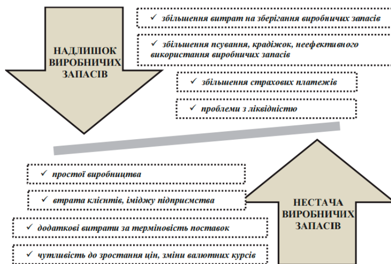
Рис. 2. Наслідки надлишку та нестачі виробничих запасів

Враховуючи цю позицію, очевидно, що для будь-якого суб'єкта господарювання небажаним явищем є як наявність надлишкових виробничих запасів, так і їх нестача. Зокрема, можливі наслідки для підприємства за умови наявності надлишкових виробничих запасів та їх нестачі представлено на рис. 2.