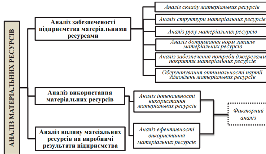
Рис. 1. Основні напрями аналізу виробничих запасів, запропоновані Л. Я. Тринькою та О. В. Липчанською (Іванчук) [1]

винен здійснюватися в трьох ключових напрямках: аналіз забезпеченості підприємства матеріальними ресурсами, аналіз використання виробничих запасів і аналіз впливу матеріальних ресурсів на виробничі результати підприємства (рис. 1).