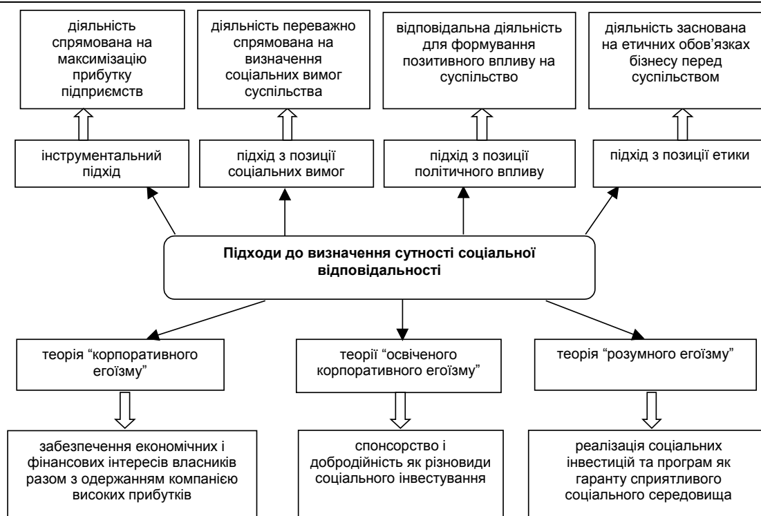
Рис. 1. Підходи до визначення сутності соціальної відповідальності

Жоден з підходів до визначення сутності соціальної відповідальності не є вичерпним і сталим у тривалому часовому вимірі. Вони відображають діаметрально протилежне бачення соціальної відповідальності бізнесу та дають можливість оцінити, наскільки змінилися зв'язки підприємств із суспільством. Найбільш поширеними підходами вважають інструментальний, підхід з позиції соціальних вимог, з позиції політичного впливу та з позиції етики, однак у західному науковому й діловому співтовариствах широко використовують теорію "корпоративного егоїзму", "освіченого корпоративного егоїзму", "розумного егоїзму", в яких головна увага зосереджена на прибутку компанії.