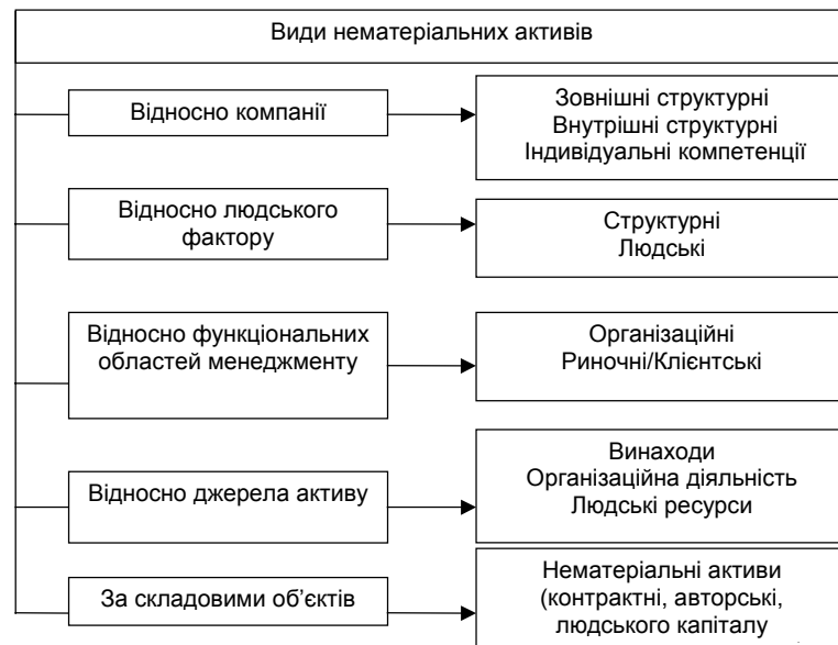
Рис. 3. Класифікація нематеріальних активів

Нематеріальні активи мають велике значення у формуванні ресурсного потенціалу, бо саме за допомогою використання інтелектуальної власності, різноманітних комп’ютерних програм, ліцензій сільськогосподарські підприємства підвищують свою можливість більш ефективно використовувати усі ресурси, підвищувати свій потенціал, інвестиційну привабливість, вартість підприємств, фінансові показники своєї діяльності [6]. Основні види нематеріальних активів подано на рис. 3.