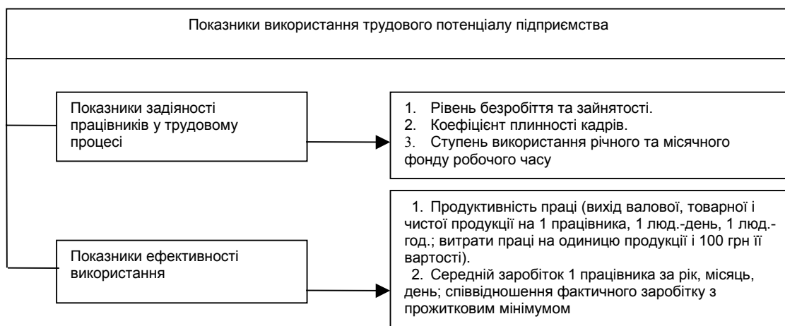
Рис. 2. Показники використання трудових ресурсів на підприємстві

Однією із найважливіших складових ресурсного потенціалу є трудові ресурси підприємства. Показники використання поділяють на дві групи: показники задіяності працівників у трудовому процесі та показники ефективності використання. Показники використання трудових ресурсів на підприємстві розглянуто на рис. 2.