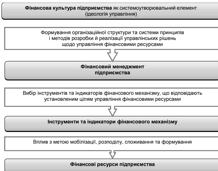
Рис. 1. Системно-динамічний підхід до управління фінансовими ресурсами підприємства

Спираючись на теоретико-методологічні підходи О. Є. Гудзь [1] і П. А. Стецюка [9] до розкриття економічного змісту фінансових ресурсів, доповнюючи та розвиваючи ці підходи, під фінансовими ресурсами підприємства розуміємо його найліквідніші активи, здатні набувати динамічного стану.