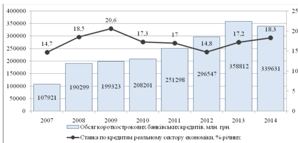
Рис. 3. Динаміка обсягів короткострокового кредитування в поточну діяльність реального сектора економіки

заставою. До того ж зазначений інструмент не має вбудованих механізмів, що забезпечували б його гнучкість та еластичність. Разом з тим, українські підприємства продовжують активно залучати короткострокові кредити, незважаючи на зростання процентної ставки за ними в останні роки, що наглядно ілюструє рис. 3.