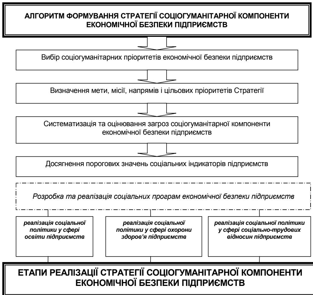
Рис. 2. Етапи формування та реалізації стратегії соціогуманітарної компоненти економічної безпеки підприємств

У сучасних посттрансформаційних умовах більш детально ми сформуваємо етапи формування та реалізації стратегії соціогуманітарної компоненти економічної безпеки підприємств (рис. 2).