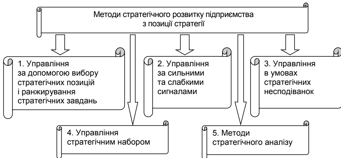
Рис. 2. Методи стратегічного розвитку підприємства з позиції стратегії

В умовах нестабільності зовнішнього середовища доцільно використовувати низку стратегій, які можуть забезпечити розвиток та успіх підприємства. Організація за допомогою методу аналізу відхилень від цілей може обирати ту стратегію, яка максимально відповідає поставленим цілям.