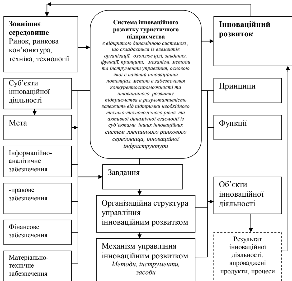
Рис. 2. Складники системи інноваційного розвитку туристичного підприємства

ське визначення поняття системи інноваційного розвитку туристичного підприємства, відповідно до якого система інноваційного розвитку туристичного підприємства є відкритою динамічною системою, що складається з елементів організації, охоплює цілі, завдання, функції, принципи, механізм, методи та інструменти управління, основою якої є наявний інноваційний потенціал, метою – забезпечення конкурентоспроможності та інноваційного розвитку підприємства, а результативність залежить від підтримки необхідного техніко-технологічного рівня та активної динамічної взаємодії із суб'єктами інших інноваційних систем зовнішнього ринкового середовища, інноваційної інфраструктури. Результативність та ефективність функціонування системи інноваційного розвитку залежать від потенціалу підприємства,