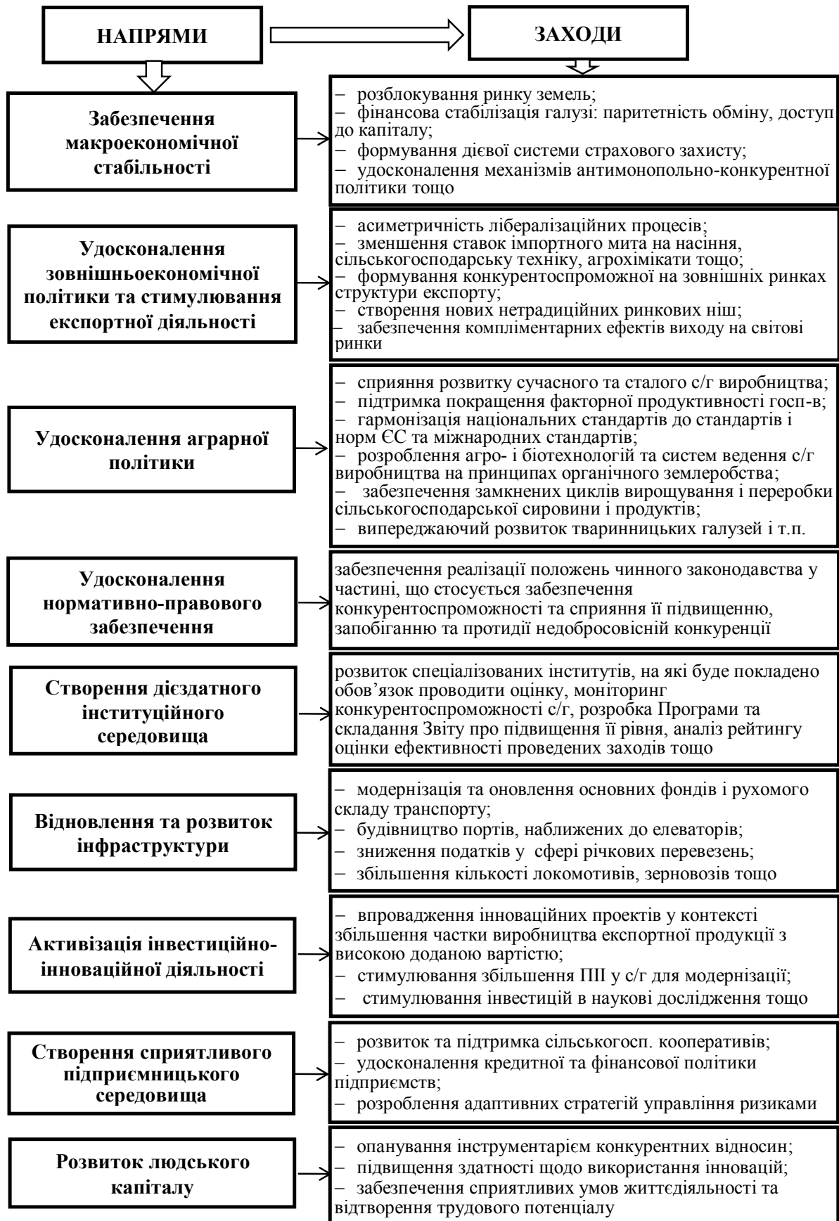
Рис. 2. Стратегічні напрями та заходи підвищення конкурентоспроможності сільського господарства України