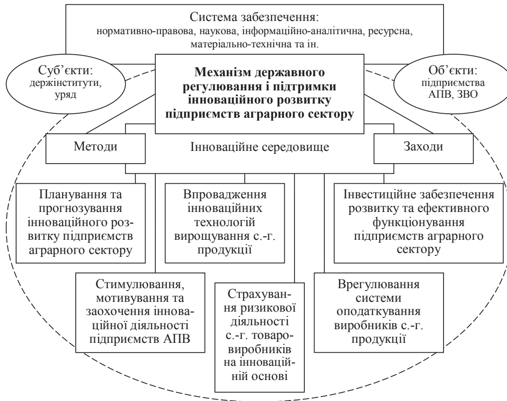
Рис. 2. Організаційно-економічний механізм державного регулювання і підтримки інноваційного розвитку підприємств аграрного сектору