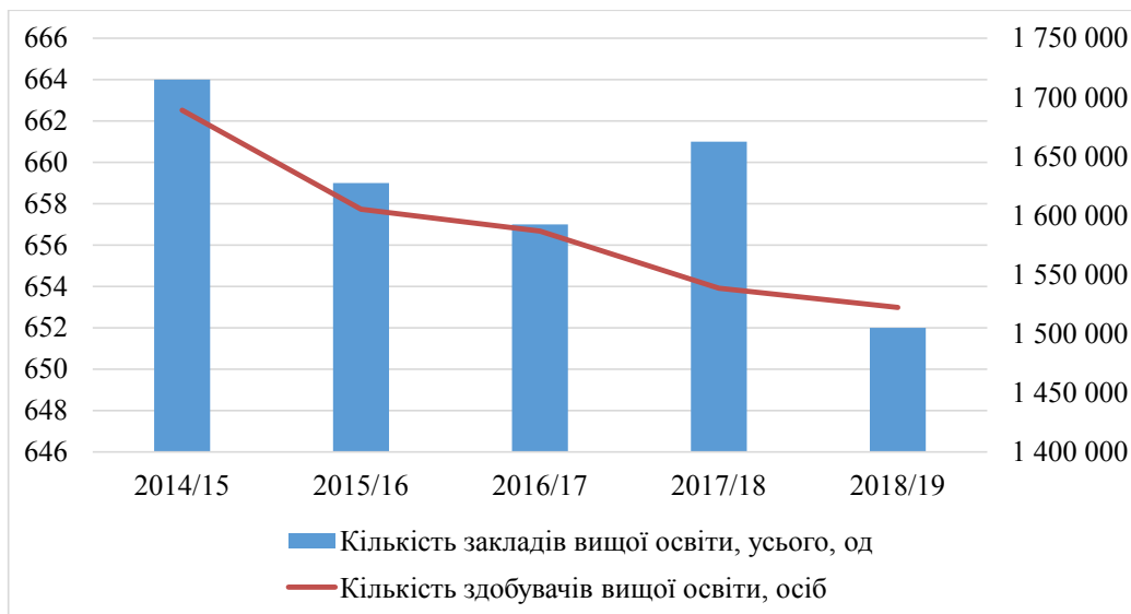
Рис. 2. Динаміка кількості здобувачів вищої освіти та закладів вищої освіти в Україні в 2014–2018 навчальних роках