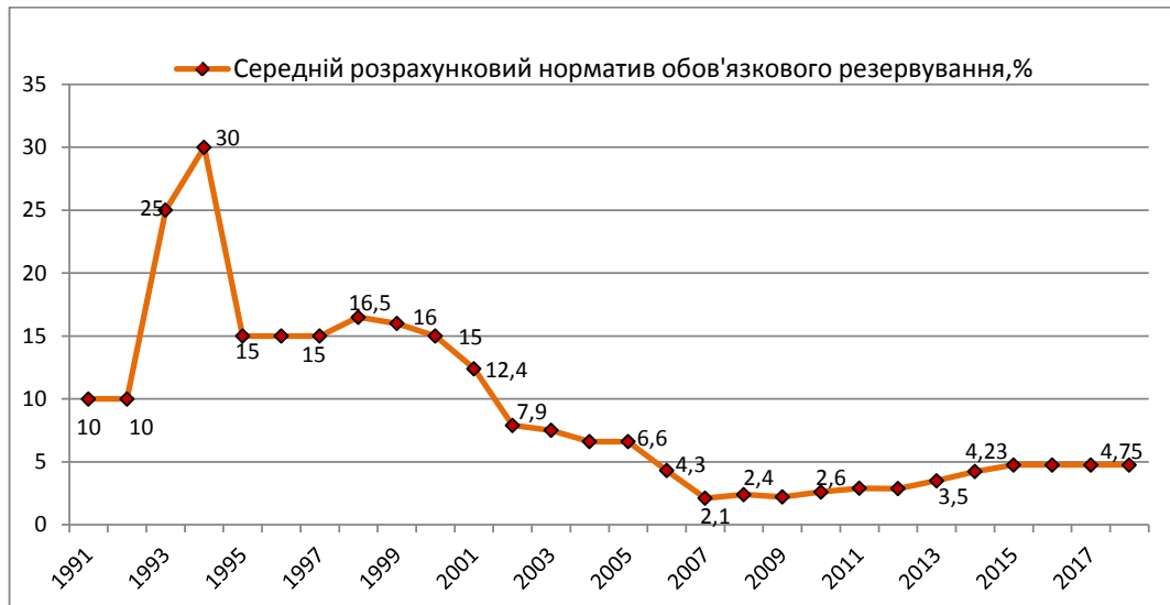
Рис. 1. Динаміка середнього розрахункового нормативу обов'язкового резервування.