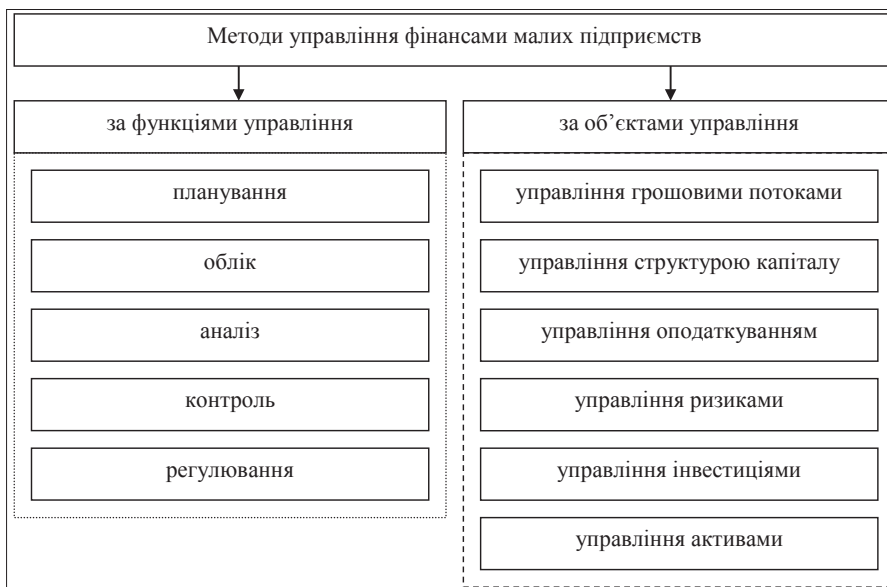
Рис. 2. Методи управління фінансами малих підприємств