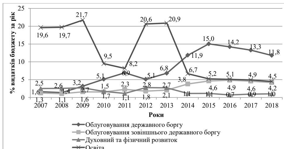
Рис. 3. Порівняння видатків на обслуговування державного боргу та видатків державного бюджету України соціального спрямування у 2007–2018 рр., %

ри країни. При цьому найбільше від нестачі фінансування страждають такі важливі сфери, як охорона здоров'я, освіта, духовний та фізичний розвиток.