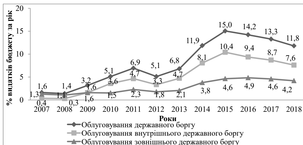
Рис. 1. Витрати на обслуговування державного боргу в загальному обсязі витрат державного бюджету України у 2007–2018 рр., %

Водночас частка витрат на соціальний захист та соціальне забезпечення має нестабільне значення впродовж 2007–2018 рр. та у цілому скоротилася на 22,29% у 2018 р. порівняно з 2007 р. (16,6% проти 21,5% відповідно). Частка витрат на охорону здоров'я нестабільна впродовж 2007–2018 рр., проте значно скоротилася у 2014 р. порівняно з 2013 р.