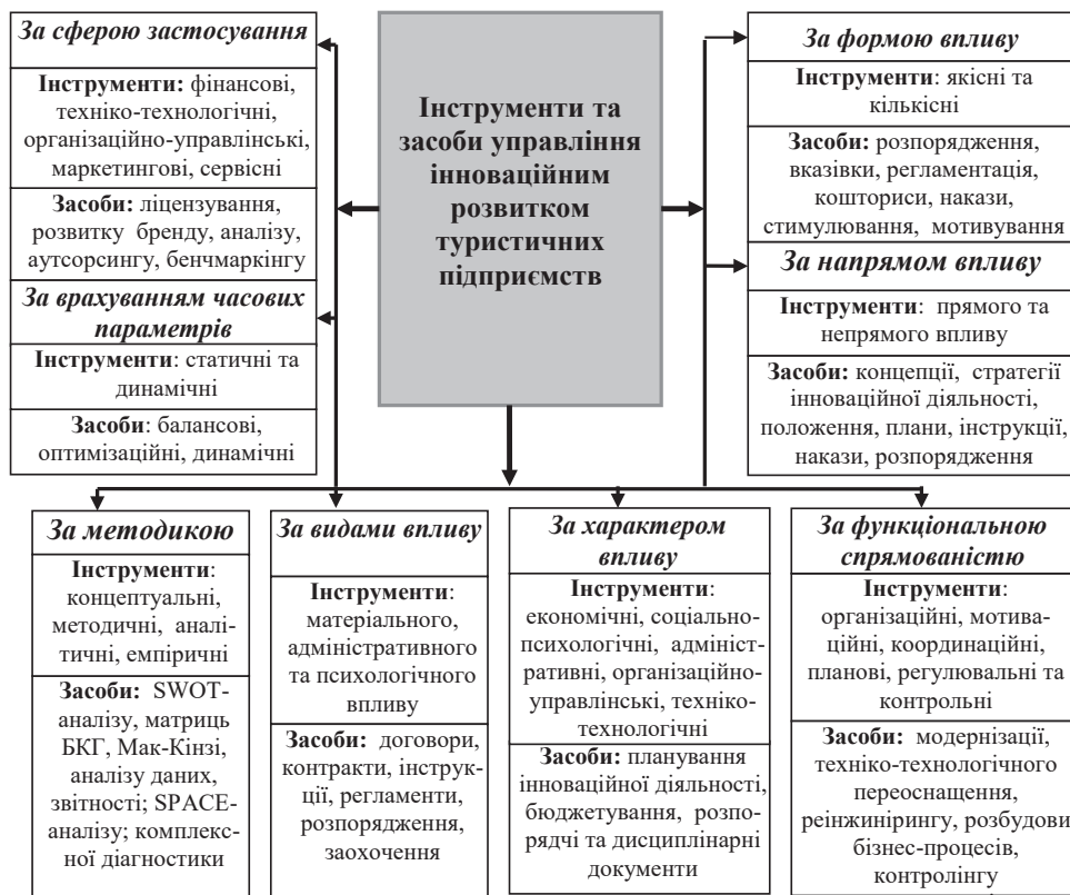
Рис. 2. Узагальнена класифікація інструментів та засобів управління інноваційним розвитком туристичних підприємств

Основними принципами, на яких функціонує система інноваційного розвитку туристичного підприєм-