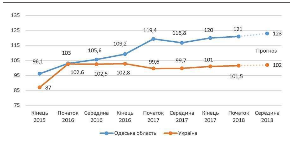
Рис. 1. Темп зростання промислового виробництва Одеської області та України за 2015–2018 рр., % [11]

Структуру зареєстрованих безробітних станом на 1 вересня 2019 р. наведено на рис. 2.