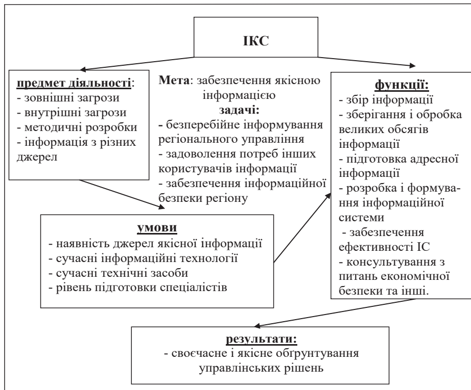
Рис. 1. Схема інформаційно-консультаційної служби у системі забезпечення економічної безпеки на рівні регіону (авторська розробка)