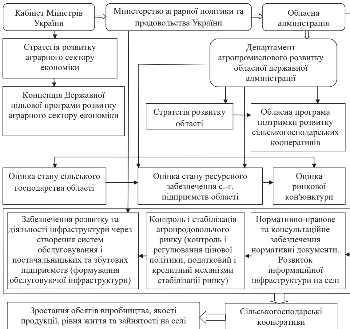
Рис. 3. Механізм регулювання діяльності кооперативів на основі державної підтримки та вдосконалення обслуговуючої інфраструктури