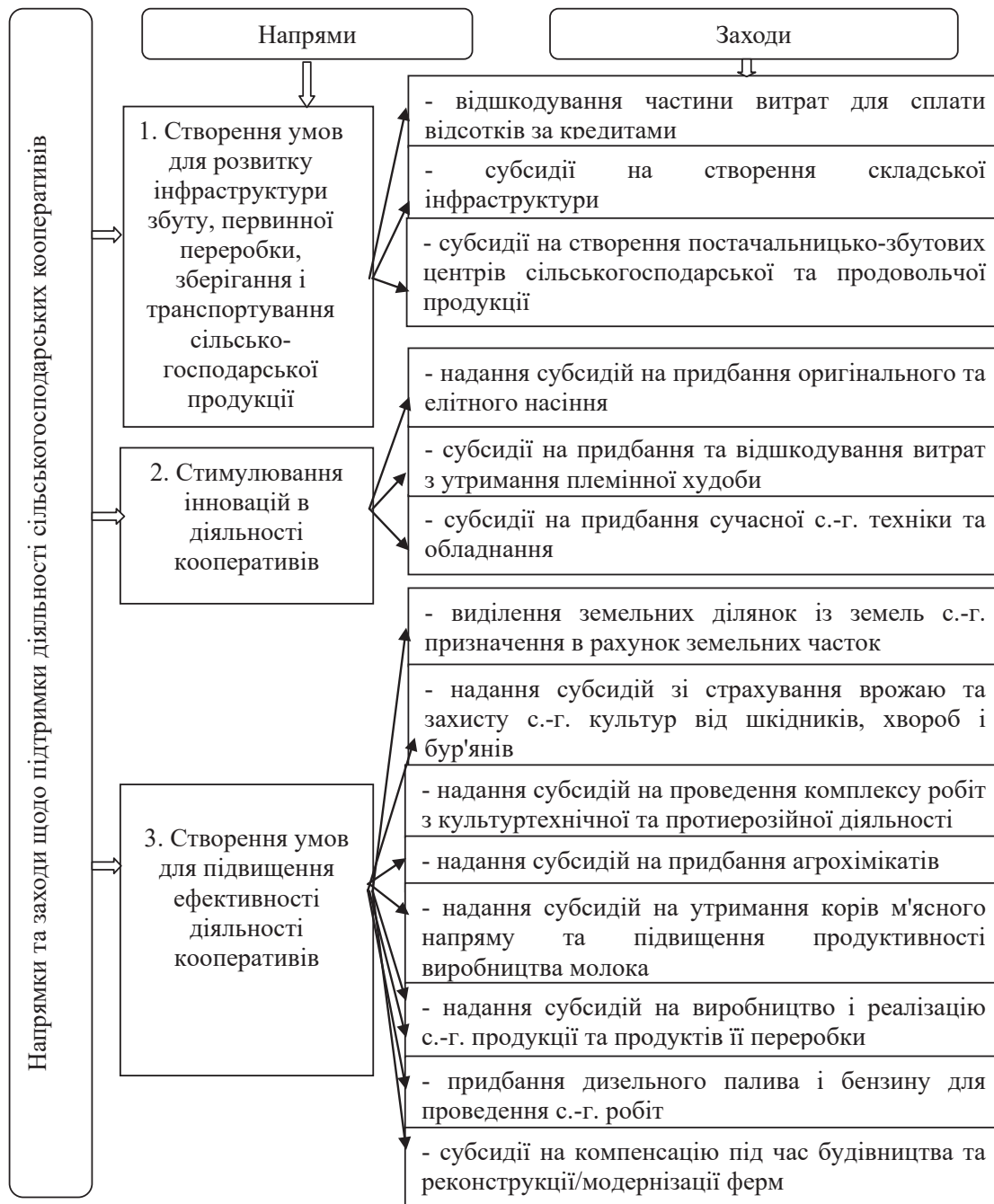
Рис. 2. Пріоритетні напрями та заходи державної підтримки діяльності сільськогосподарських кооперативів

інноваційних змін у системі ринкових відносин. Ситуація, що склалася нині у сфері сільського господарства, вимагає державного регулювання та створення усіх необхідних умов для адаптації кооперативних підприємств до нестабільних макроекономічних умов.