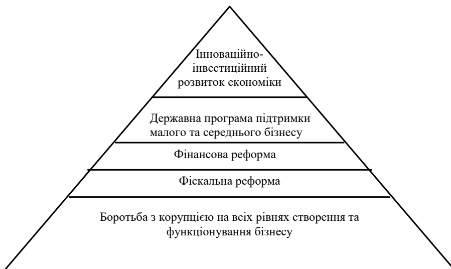
Рис. 1. «Піраміда реформ»

Перш за все інвестори звертають увагу на такі складові частини, як законодавство країни, економічна та політична ситуація в країні, в яку інвестують. Якщо хоча б один із факторів є несприятливим, інвестування вважається ризикованим і ставиться під сумнів. Кожен інвестор, вибираючи, в яку країну