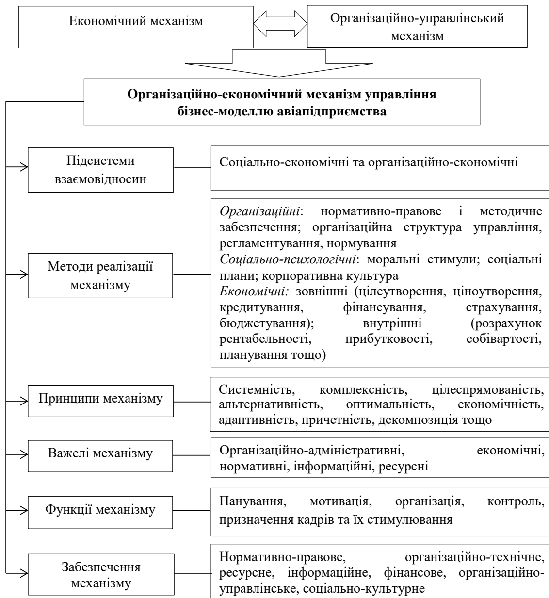
Рис. 1. Основі складові елементи організаційно-економічного механізму (ОЕМ) управління бізнес-моделлю авіапідприємств