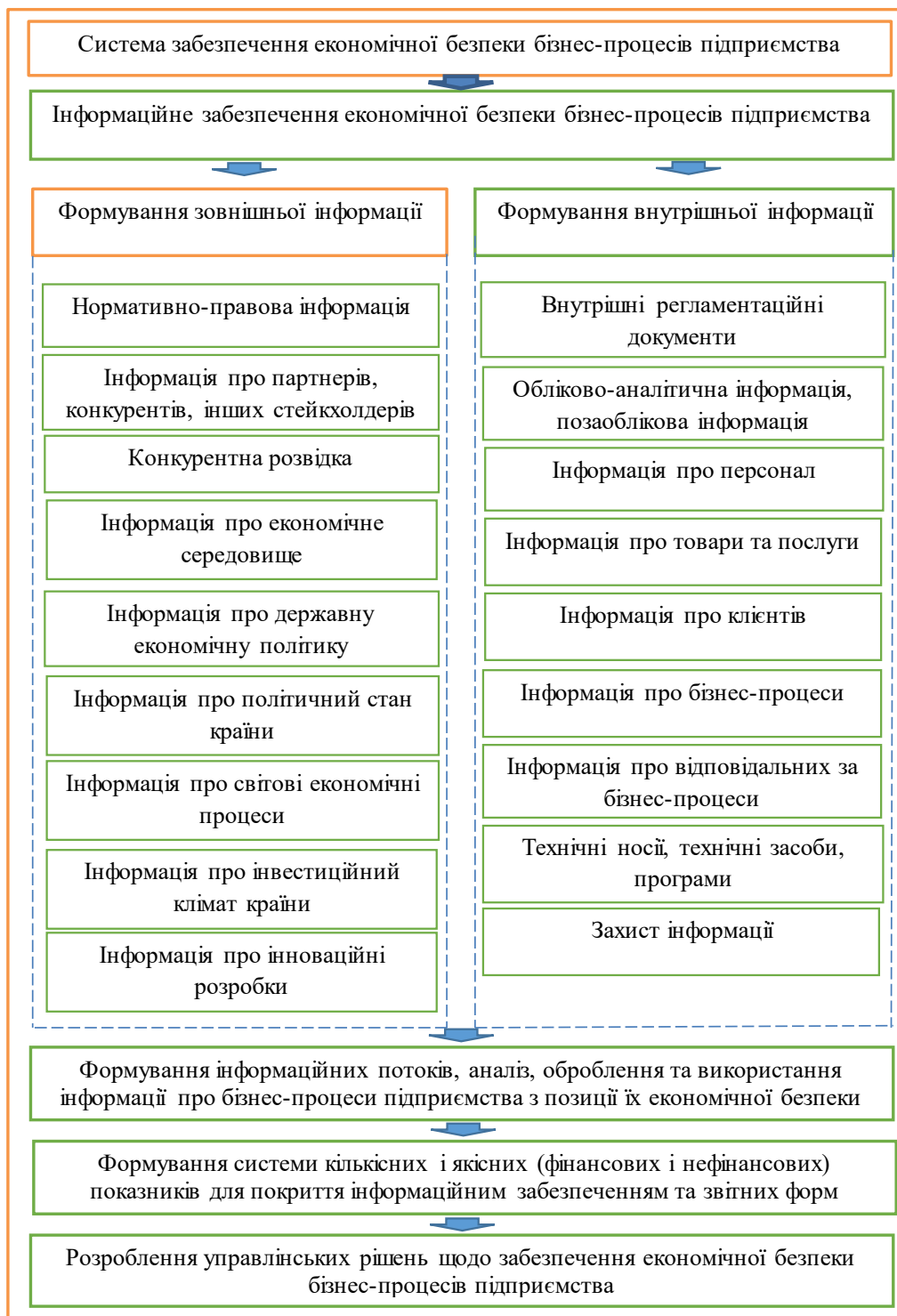
Рис. 2. Схема інформаційного забезпечення економічної безпеки бізнес-процесів підприємства торгівлі

мічної розвідки (збирання та первинне оброблення зовнішньої і внутрішньої інформації), інформаційної безпеки (перевірка достовірності інформації, її захист, визначення рівня доступу) та аналітично-консультативного забезпечення (глибокий аналіз інформації, прогнозування та моделювання, відпрацювання рекомендацій, проведення консультацій), а також має забезпечувати надходження інформації