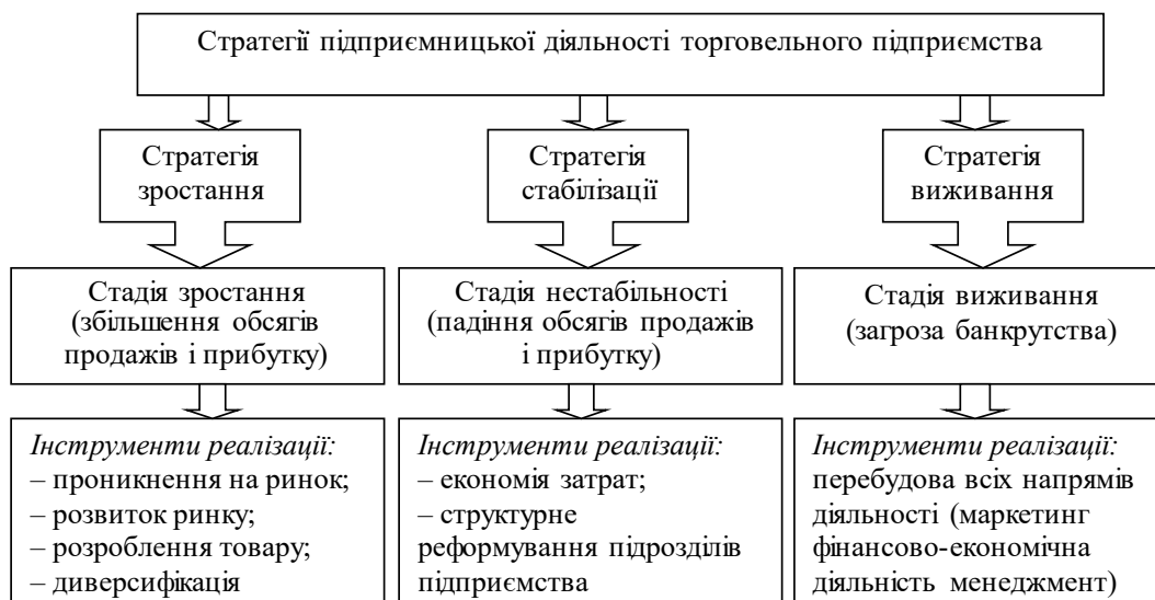
Рис. 1. Ключові стратегії підприємницької діяльності торговельного підприємства