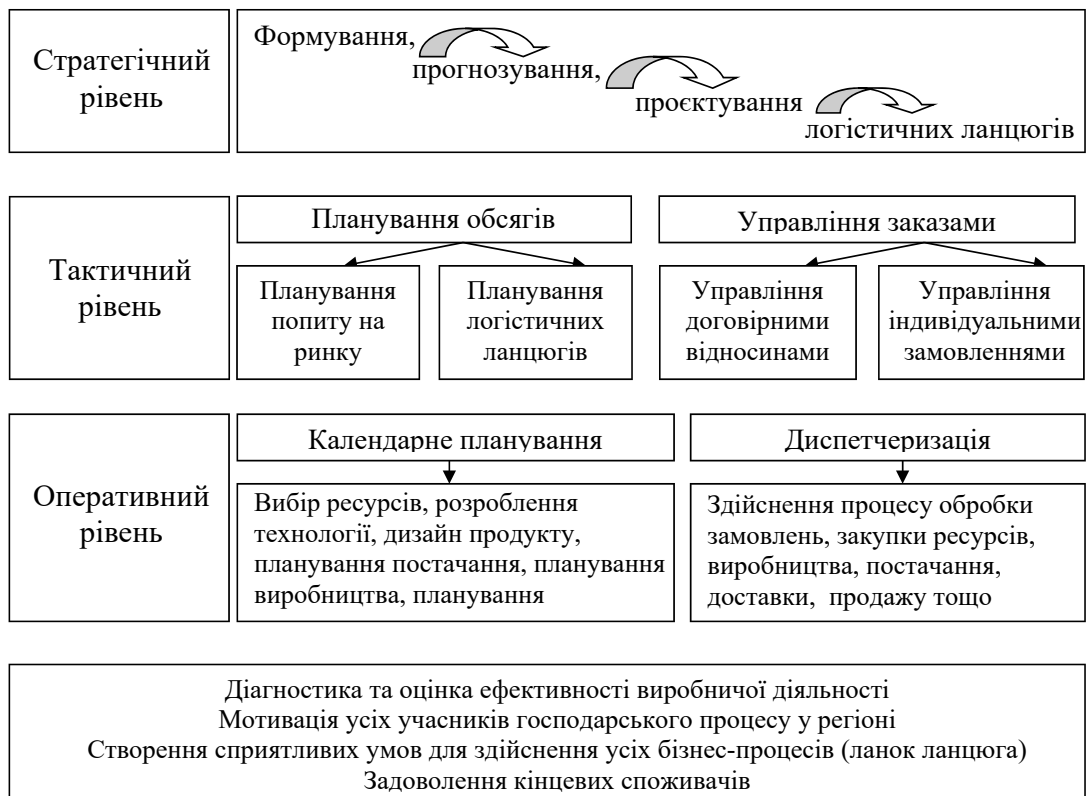
Рис. 3. Особливості планування ланцюгів ресурсного забезпечення регіональних товарних ринків за принципами діагностики діяльності та мотивації їх учасників