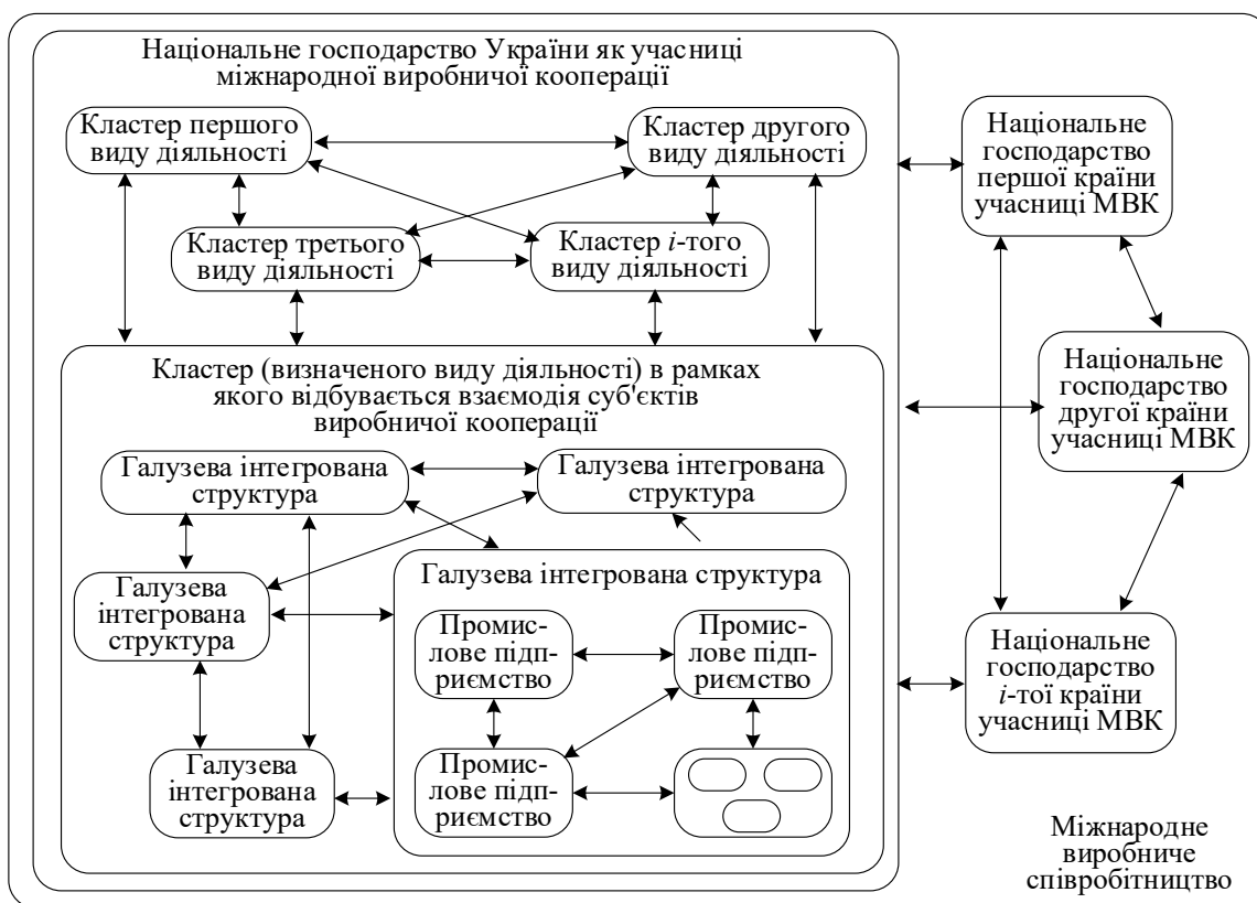
Рис. 1. Холістичний підхід до опису мереж міжнародної виробничої взаємодії та виділення системного підґрунтя формування механізму кооперації

Подані на рис. 2 елементи визначають абстрактні сутності, рух системи за якими дає змогу слідкувати за просуванням її за життєвим циклом (відповідає динамічному трактуванню категорії механізму). Поданий на рис. 2 зв'язок об'єктів зі стандартом розширеної пропозицією А. Левенчука [11] щодо додавання рівня «стратегування». Авторським внеском тут є визначення за допомогою OMG Essence [22]