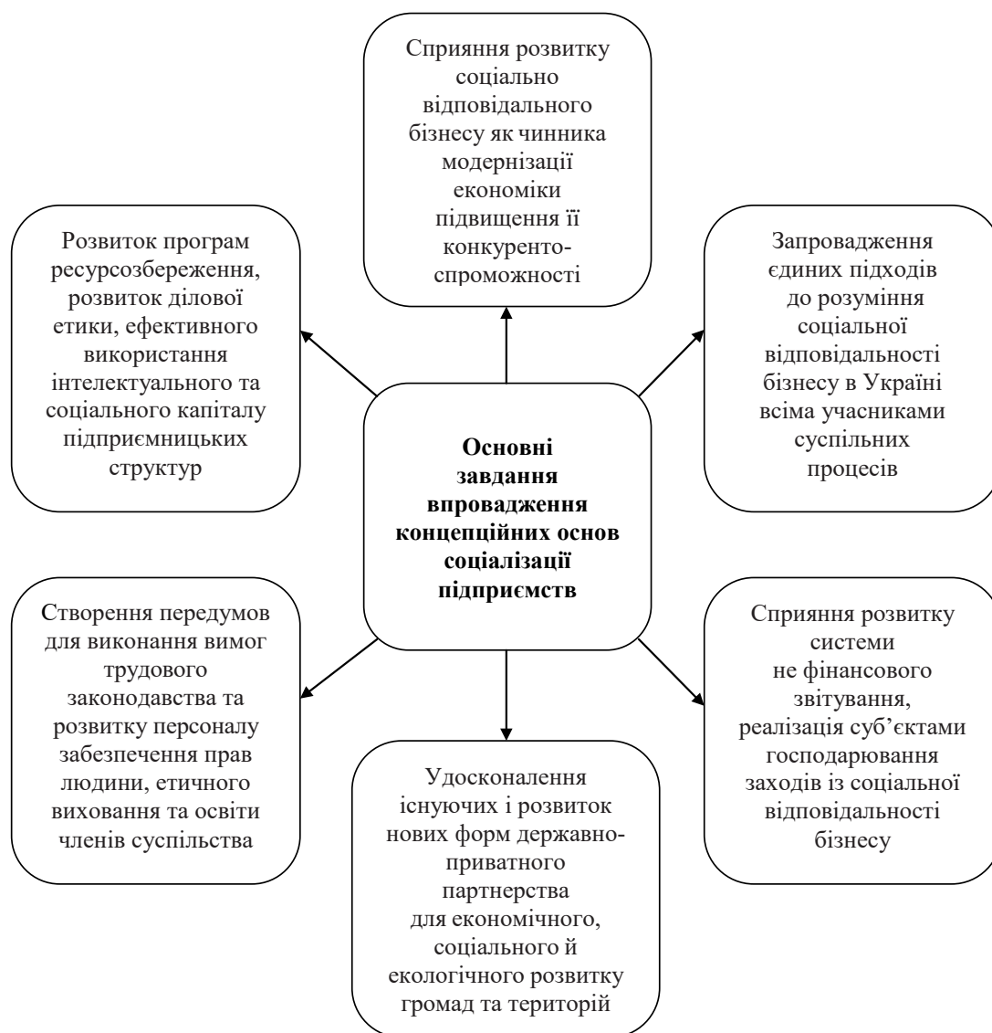
Рис. 1. Основні завдання впровадження концепційних основ соціалізації підприємств

Проте, як свідчить міжнародний досвід, саме соціальні підприємства відіграють важливу роль у