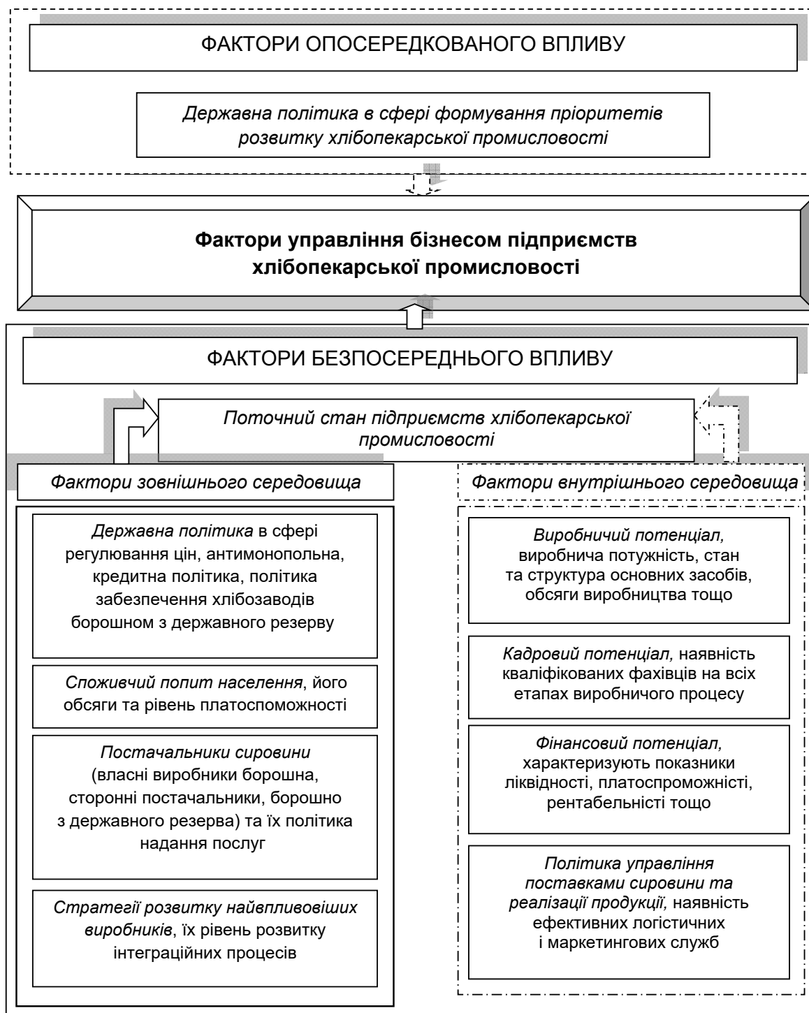
Рис. 2. Систематизація факторів впливу на управління бізнесом хлібопекарських підприємств

розвинутості ринків: фондового (кількість та вартість акцій підприємств харчової промисловості) гуртових та роздрібних; протекціоністську політику в країні та регіоні по відношенню до вітчизняних виробників; рівень інформованості підприємств про кон'юктуру на гуртовому та роздрібному ринках. Ю.І. Продіус та О.О. Олейникова [8, с. 280] вважають, що зовнішні фактори можуть впливати на процеси реструктуризації прямо чи опосередковано. На їх думку, до факторів прямої дії відносяться держава, постачаль-