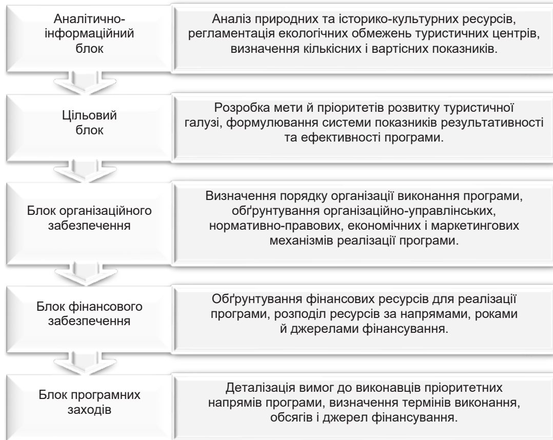
Рис. 1. Структура регіональних цільових програм розвитку туризму

На нашу думку, основна мета програми – досягнення соціально-економічного та культурного відродження туризму в регіоні. Ця мета повинна бути відповідно конкретизована за напрямками, наприклад, з досягнення певних показників збільшення туристичних потоків у регіон і надходжень в бюджет. Потім розробляють відповідний комплекс заходів щодо фінансування програми. Фінансування може здійснюватися з місцевого бюджету, частково з державного бюджету, з різних фондів, позабюджетних коштів тощо. Якщо розробляють комплекс заходів щодо введення податкових пільг, то необхідно розрахувати