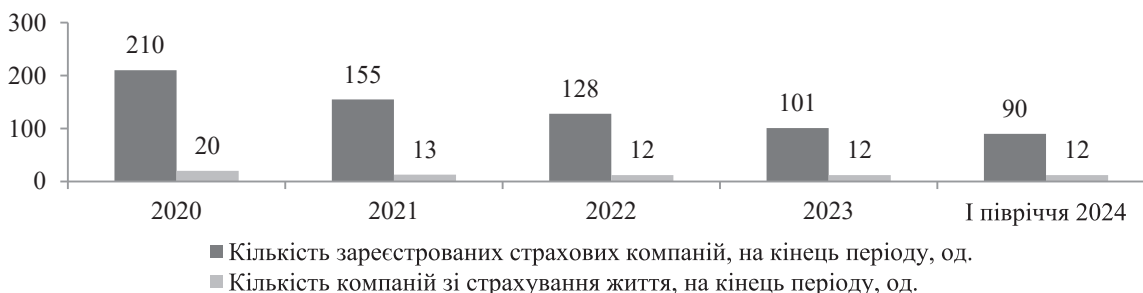
Рис. 1. Кількість зареєстрованих страхових компаній, на кінець періоду та з них компаній зі страхування життя, од.

Аналіз показників діяльності кредитних спілок, станом на відповідні дати, демонструє значні виклики для небанківського фінансового сектору. Кількість зареєстрованих кредитних спілок зменшилась з 322 у 2020 році до 133 у 2023 році та