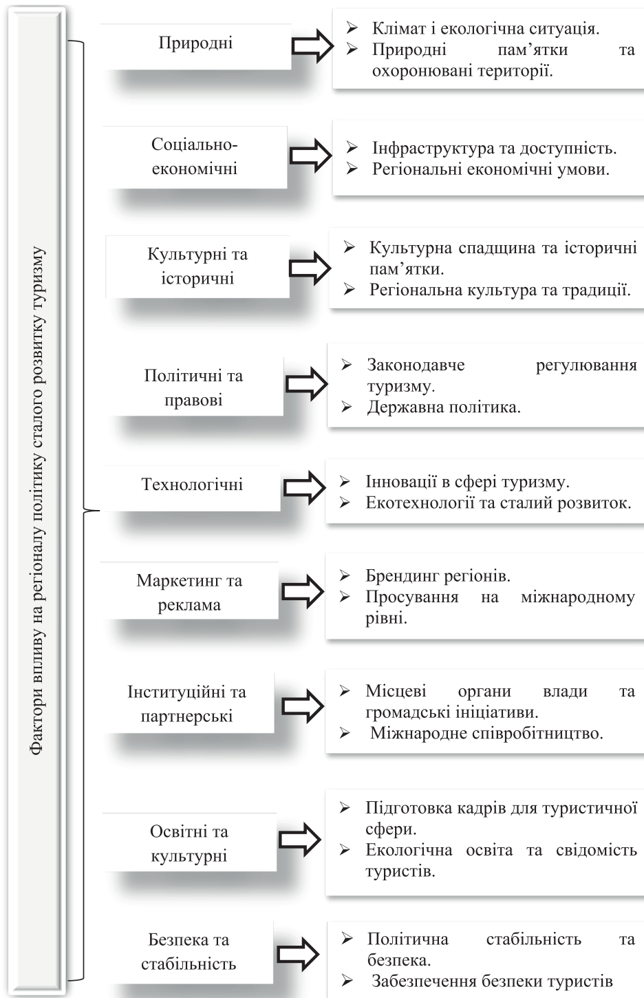
Рис. 2. Основні фактори впливу на формування регіональної політики сталого розвитку туризму

регіональної політики сталого розвитку туризму сьогодні особливої уваги набувають політичні та правові фактори, безпека та стабільність. Це передусім створення нормативно-правових актів, що сприяють розвитку сталого туризму (підтримка екологічного туризму, організація територій для рекреації, захист прав туристів тощо); визначення на рівні держави стратегічних напрямів розвитку туризму, сприяння децентралізації та розвитку місцевих ініціатив. Безпека